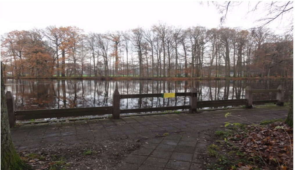
Gerenvoerde invalidensteiger Biljoen

Hij telde niet mee, maar bleef wel een onderwerp van gesprek tijdens de prijsuitreiking en ook nu nog.