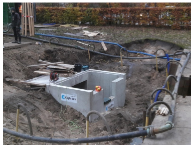
Plaatsen van stuwput

Met de gemeente Rheden is besproken dat zij in elk geval een zodanige constructie maken boven de fontein, dat daar in elk niet meer genesteld kan worden en de fontein als ze niet verstopt zitten weer kunnen spuiten.