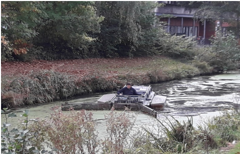
Bagger opschuiven naar een hoek

Of dit ook kan voorkomen dat de filters van de fontein binnen een dag weer dichtzitten en de watervogels hier weer op gaan broeden is maar helemaal de vraag. Hier zijn zeer waarschijnlijk voor het grootste deel de onderwaterplanten verantwoordelijk voor.