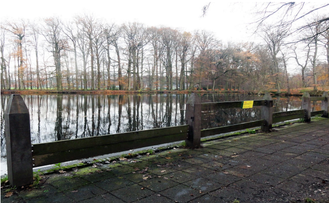
Vernieuwde steiger Biljoen