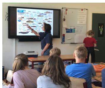
Visles op school