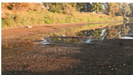
Laak bijna droog